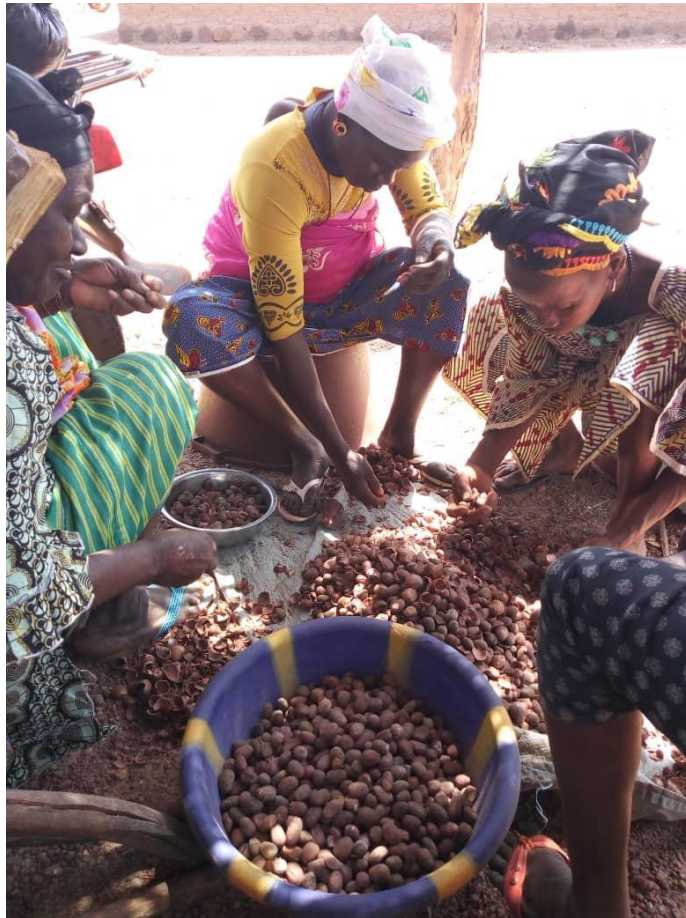
Membres de la coopérative des femmes de la localité de Kaiï qui trient les noix de karité en vue de les transformer en beurre de karité..

Ce sont 90 % des montants recueillis qui sont alloués aux organisations de femmes, 10 % contribuant aux frais de gestion du CECI. Ainsi 290 267 $ , dont 57 167 $ en début 2019, ont été alloués à 26 associations regroupant près de 1 222 femmes. Ces associations sont des coopératives et des groupements à statut divers, situées dans les quartiers pauvres de Bamako, dans des régions comme Tombouctou et Kayes au nord du pays, ainsi que Sikasso. Elles ont pour objectif d'améliorer les conditions de vie de leurs membres.