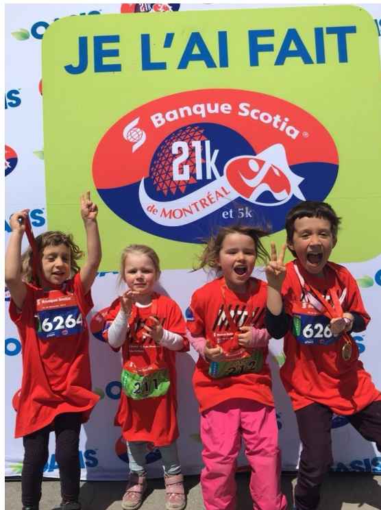
L'engagement n'a pas d'âge!