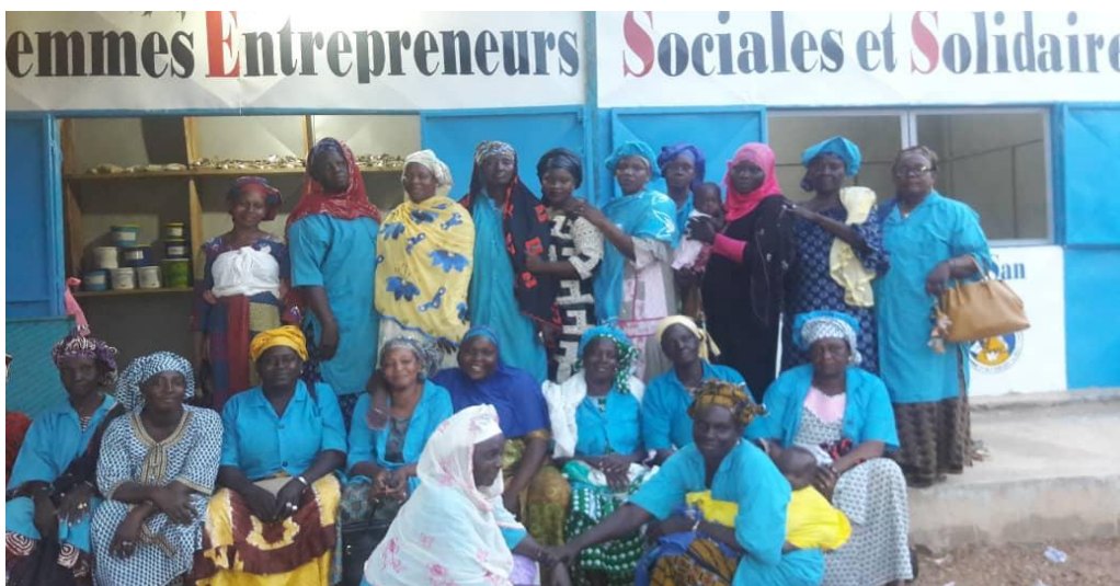
Les membres de la coopérative des femmes d'économie sociale et solidaire de la localité de San devant leur magasin de vente de produits agroalimentaires transformés.

3000, rue Omer-Lavallée Montréal (QC) H1Y 3R8 Canada