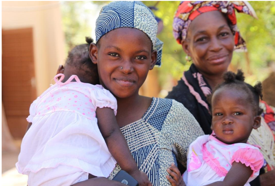
Les femmes et leurs enfants au centre de santé de Yrimadjo, quartier pauvre de Bamako

Ce bilan a pour objectif d'informer les donateurs et les donatrices du Fonds Armande Bégin pour la promotion des femmes au Mali du CECI (Centre d'étude et de coopération internationale) sur les montants recueillis, l'allocation des fonds et les résultats obtenus en 2018.