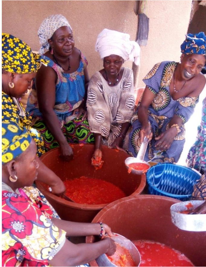
Membres d'une association de femmes de la région de Niono qui fabriquent et vendent du concentré de tomates à partir de leur production.

Ce sont 14 % des fonds alloués en 2019 qui contribuent au renforcement des organisations et leur permettent d'améliorer leur gestion et leur fonctionnement.