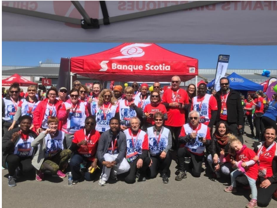
Une partie des participant-e-s au Défi caritatif de la banque Scotia en 2018